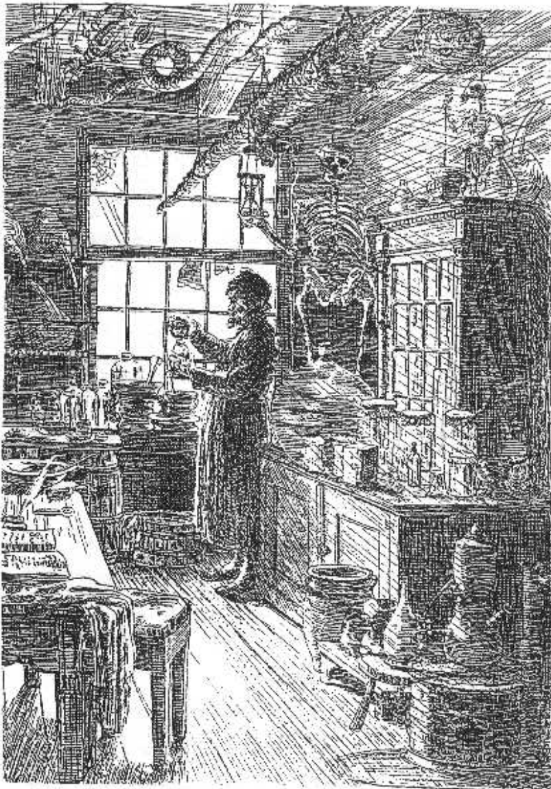
Plaatje 3: De apotheker aan het werk